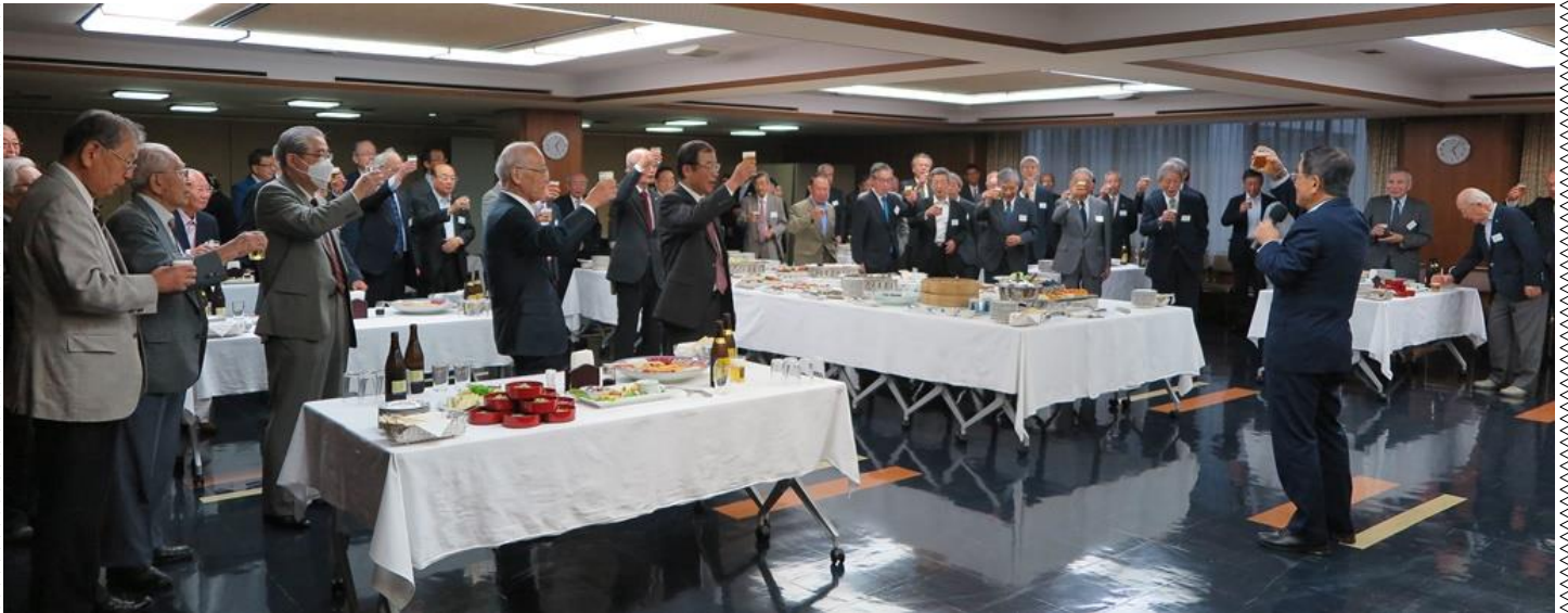
秋季会員親睦会 (於大会議室)

10月6日(金)17時、待ち望んでいた秋季会員親睦会が4年ぶりに開催されました。67名の会員が美味しい料理と楽しい会話を楽しむために、会場に集まりました。